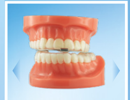
Freiheit in der Seitwärtsbewegung